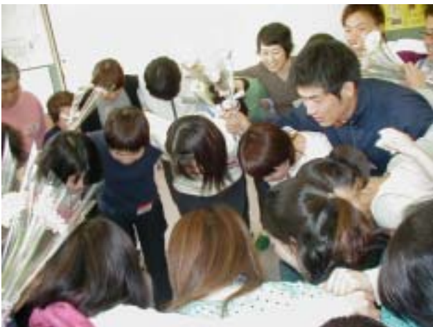
チックサク、チックサク、ホイホイホイ!

幼稚園教員を目指し“子どもと触れ合いたい” という一心でリーダーを希望した当初、一人の子 どもの成長を見守り、喜び合うことや、子どもた ちのことを真剣に考え本音でぶつかり合える仲間 と出会えるとは、想像もしていませんでした。Y