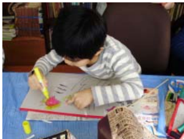
《どなたかができるかな?》