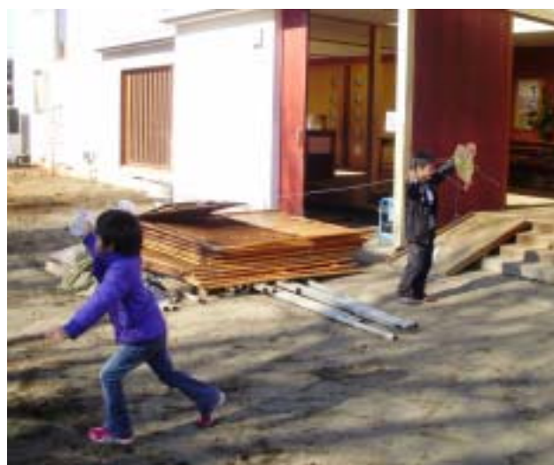
《うまくあがるかな?》