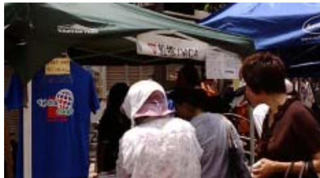
《これは去年のお店の様子です》

船橋Y M C Aは、ジョイ&ショッピングフェアフリーマーケットに参加しますので、みなさんお買い物にお出てください。Y M C Aのお店は船橋駅から向かって本町2丁目交差点を右折したA26区画にあります。