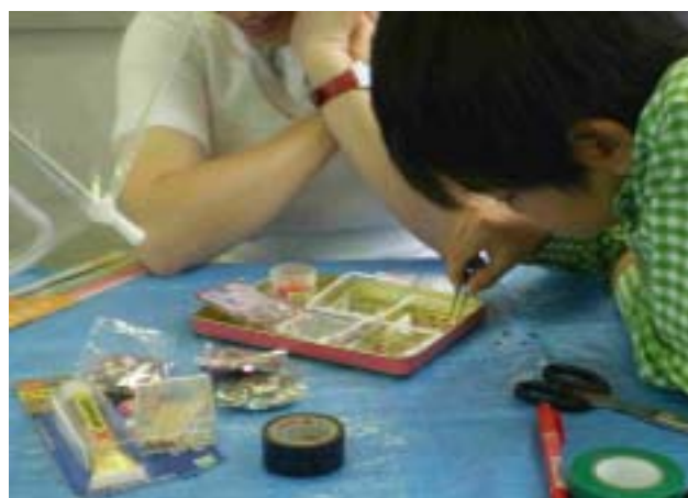
《傘につける飾りを選びます》