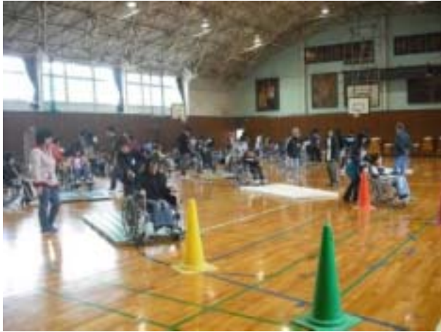
《車いす体験コースの全景》

うとペダルを回すと、自分の思ったとおりに動くことができず、段差などでは周りの誰かに助けてもらわないと越えることができないので、車いすに一人で乗るといのはすごく難しいことだなあと思いました。これからすすんで声を掛けようと思います。(5年男子)