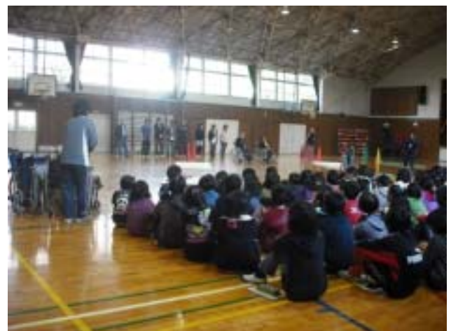
《体験教室開始前の説明を聞いています》

少し遅くなりましたが2010年11月26日に船橋市立八栄小学校で5年生188名を対象に開かれた障がい体験教室の感想文が送られてきたので紹介します。原文のひらがなを漢字に変換して読み易くしてあります。