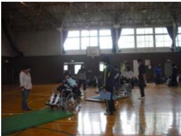
《体操マットの上は動きにくいです》

先日は、貴重なお話と体験をさせてもらい本当にありがとうございました。車いす体験では、少しの段差や障害物でもすごく大変なことがわかりました。そのため、普段の生活の中でも「段差があるな」、「自転車邪魔だな」などを気に掛けることができるようになりました。ありがとうございました。(5年女子)