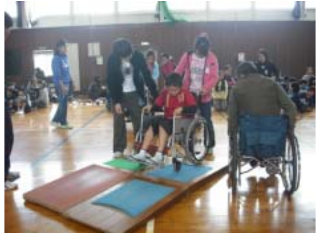
《跳び箱の踏切り板の段差を越えます》

害物があると後ろに誰かがいないと無理でした。だから僕は、自転車を端っこに寄せたり、歩く場所を考えたりしてみました。このようなことを教えてくれてありがとうございました。(5年男子)