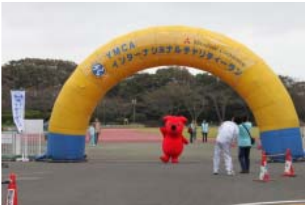
《今年はチーバくんが応援に来てくれました》

雨が小降りになったところで、チャリティーラン実行委員長と来賓のご挨拶をいただき、その後は、抽選会で大いに盛り上がりました。