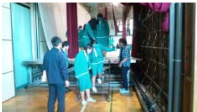
《視覚障がい体験は体育館の舞台で行いました》

車いす体験は、学校の体育館に跳び箱の踏み切り板か体操マットとパイロンを並べたコースを6つ作って、二人一組で各々車いすに乗る体験と車いすを押す体験を交代でしました。