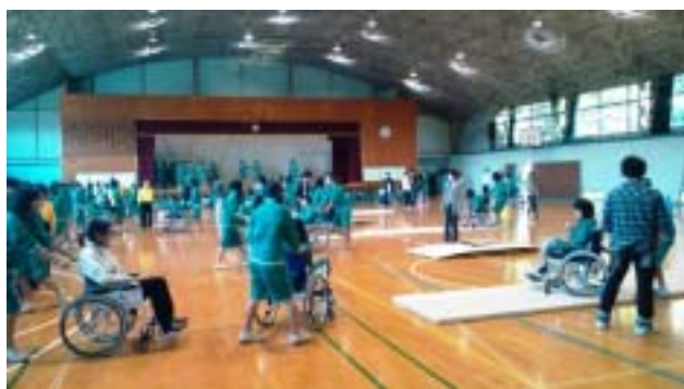
《車いす体験のコースの全体風景》

今回は3年生292名が対象で、視覚障がい体験と車いす体験を行いました。ご協力いただいたボランティアの方々は、船橋市障害者友の会2名、車椅子ダンス普及会矢車草6名、船橋市社会福祉協議会ボランティアセンター2名と千葉Y M C A高等学院の生徒と教師23名でした。