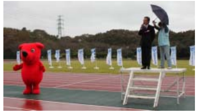
《来賓の船橋教育委員会の方のご挨拶》

今回の大会も、ランナー、ボランティアスタッフおよび来場者全体で約500名の参加を得て盛況でした。また、参加費3万円をお支払いいただいたスポンサー企業・団体は、全国オフィシャルス