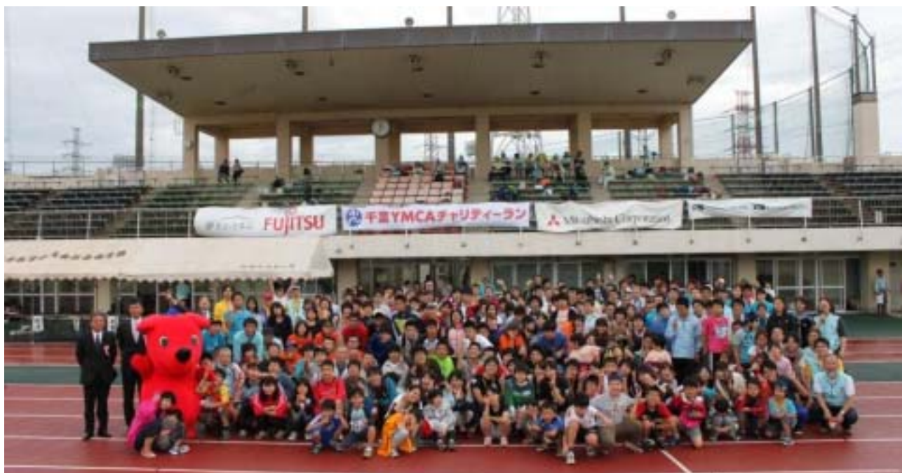
《抽選会終了後参加者全員で記念撮影をしました》

今回の大会も、ランナー、ボランティアスタッフおよび来場者全体で約500名の参加を得て盛況でした。また、参加費3万円をお支払いいただいたスポンサー企業・団体は、全国オフィシャルス