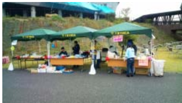
《左側の二つのテントが船橋YMCAのお店です》

10月30日(日)に千葉県長生郡長柄町にある「千葉市少年自然の家」で開かれた“秋のわいわいフェスティバル”に、船橋Y M C Aのお店を出しました。今回もY M C A学院高等学校の生徒達が売り子として活躍してくれました。