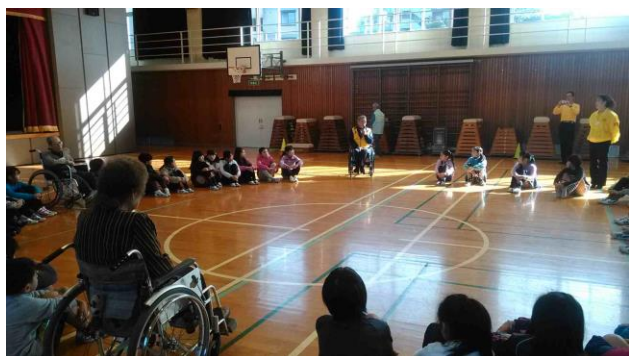
《芝山西小の車いす生活者のお話を聞く会》

12月11日は福祉体験を教えてもらって、障がいを持っている人、お年寄りを見ていやな風に思わず、困っていたらそっと声を掛け助けてあげられればいいなと思います。車いすで生活している人は大変でいやなことばかりだと思ったけれど、いい事もあったと分かりました。これからも笑顔で楽しくすごしてください。ありがとうございました。（女子）