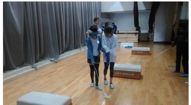
《八栄小の視覚障がい体験》