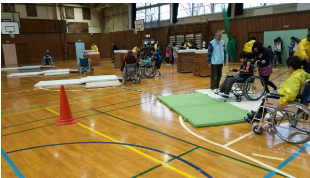
《法典東小の車いす体験》

今回は、4年生89人が対象で、車いす体験と視覚障がい体験を行いました。ご協力いただいたボランティアの方々は、車いす生活の方3名、車椅子ダンス普及会矢車草9名と千葉YMCAスタッフ2名でした。