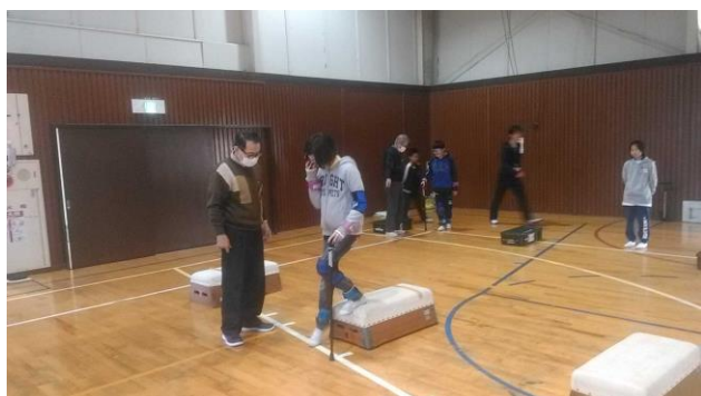
《古和釜小の高齢者体験》

をやらしていただきありがとうございました。車いすは操作がちょっと難しかったです。視覚障がいの体験はまったく見えなくて怖かったです。老人体験は、足が重かったので足を上げ難かったです。車いすダンスは楽しかったです。本日はありがとうございました。習ったことをこれから学習に生かしていきます。楽しかったです。（女子）