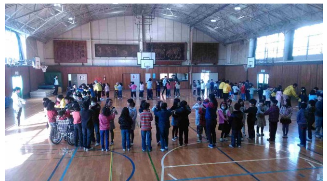
《八木が谷の車いすダンスの様子です》

ご協力いただいたボランティアの方々は、車いす生活の方2名、車椅子レクダンス普及会矢車草のメンバー8名、八木が谷地区社協のボランティア4名、ボランティアサロンふなばしのメンバー2名、ボランティアセンターのスタッフ2名と千葉YMCAのボランティア2名でした。