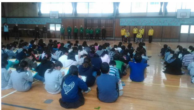
《飯山満小の障がい者の講話の様子です》

ご協力いただいたボランティアの方々は、車いす生活の方2名、車椅子レクダンス普及会矢車草のメンバー5名、二宮・飯山満地区社協のボランティア9名、ボランティアサロンふなばしのメンバー4名、ボランティアセンターのスタッフ2名と千葉YMCAのボランティア2名でした。