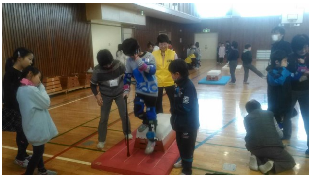
《三山東小の高齢者体験の様子です》

ご協力いただいたボランティアの方々は、車いす生活の方1名、車椅子レクダンス普及会矢車草のメンバー6名、三田習地区社協のボランティア13名、ボランティアセンターのスタッフ1名と千葉YMCAのボランティア2名でした。