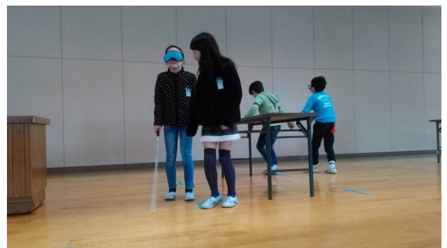
《法典東小の視覚障がい体験の様子です》

視覚障がい体験は、アイマスクをして介助者の手の袖を軽くつかんで白杖を使って歩きます。