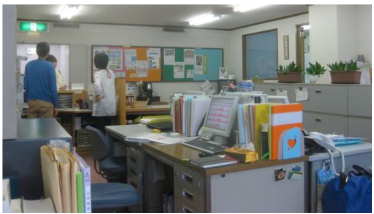
↑ 柏センター ↓ 千葉市少年自然の家(今年の「秋わい」) ↑ 千葉センター ↓ 今年のチャリティーラン