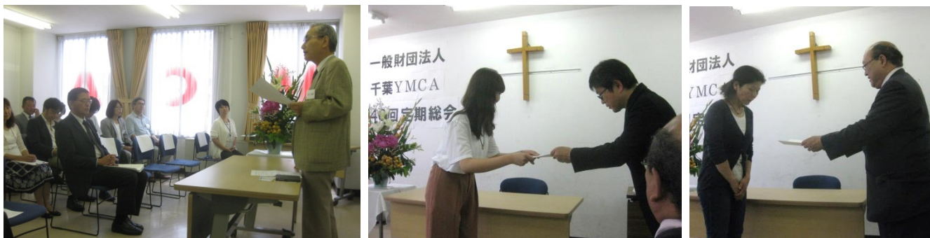
定期総会から [上左]開会礼拝 [上中]リーダー委嘱状の交付 [上右]Int.チャリティーラン益金贈呈式 [下]福山氏の報告